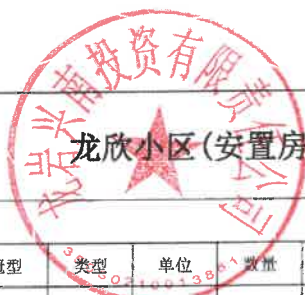
龙欣小区(安置房二期) (B地块8#-13#楼) 苗木定价表